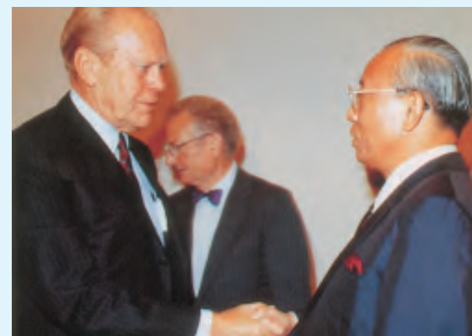
フォード元大統領との会見