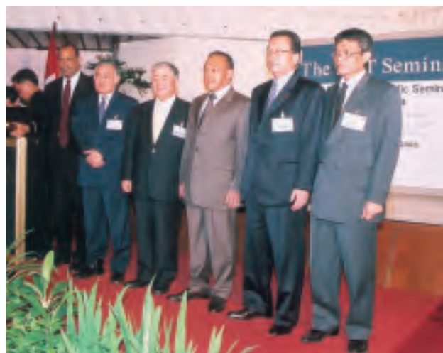
第6回アジア太平洋セミナー