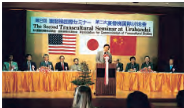
広中平祐 (ハーバード大学数学教授) 第2回裏磐梯国際セミナー