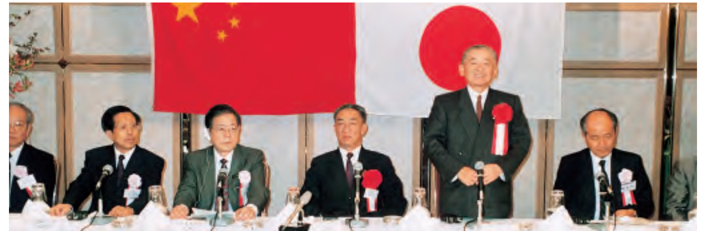
竹下登 衆議院議員・元首相 (右から2人目)、鄒家華 副総理 (右から3人目)、楊振亞 駐日大使 (右から5人目)、福川伸次 元通商産業事務次官 (右から1人目) 第1回日中ハイテク共同事業開発シンポジウム