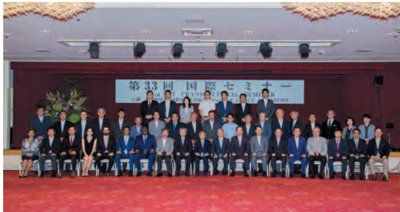
第33回国際セミナー