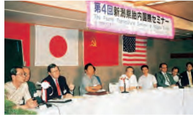
第4回新潟県胎内国際セミナー