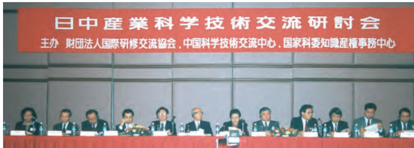
第7回日中産業科学技術交流シンポジウム