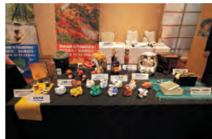
第29回国際セミナー