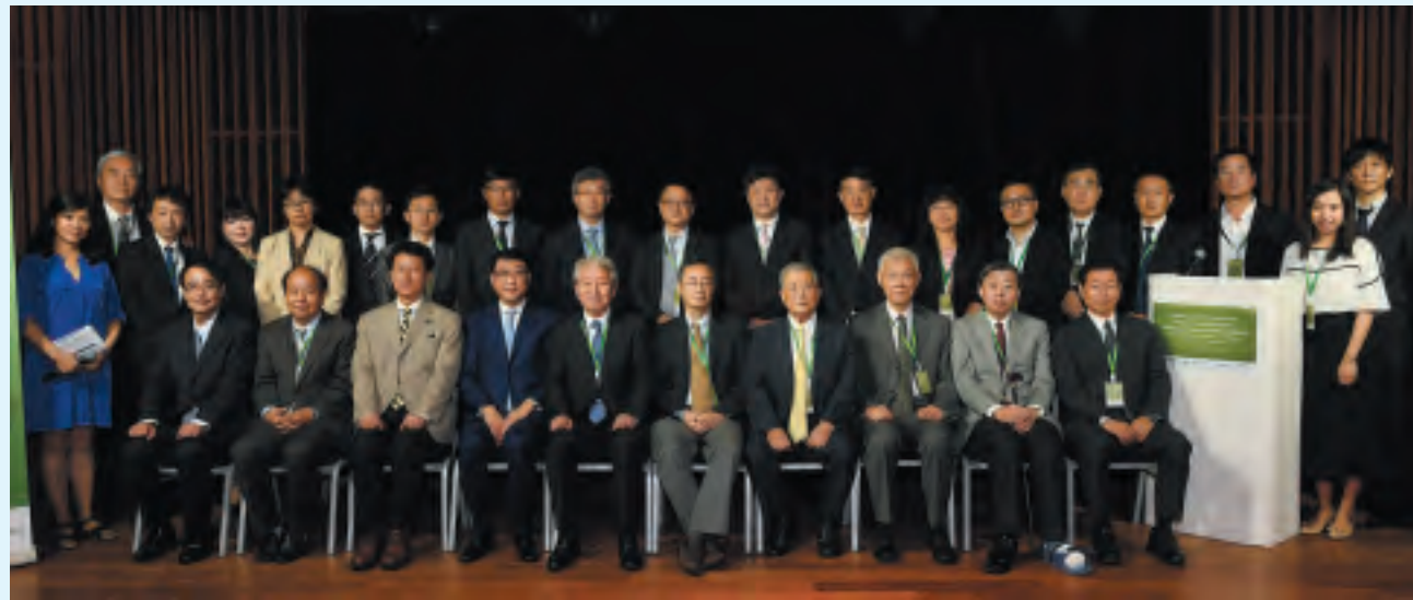
第22回 日中産業科学技術交流シンポジウム（2018年） ～日中平和友好条約締結40周年記念セミナー～ 開催：中国 香港特別行政区