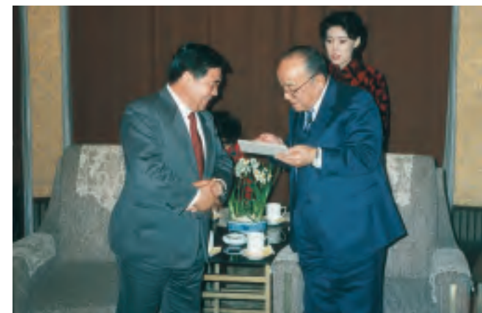
楊尚昆 国家主席との会見 (1990年3月)