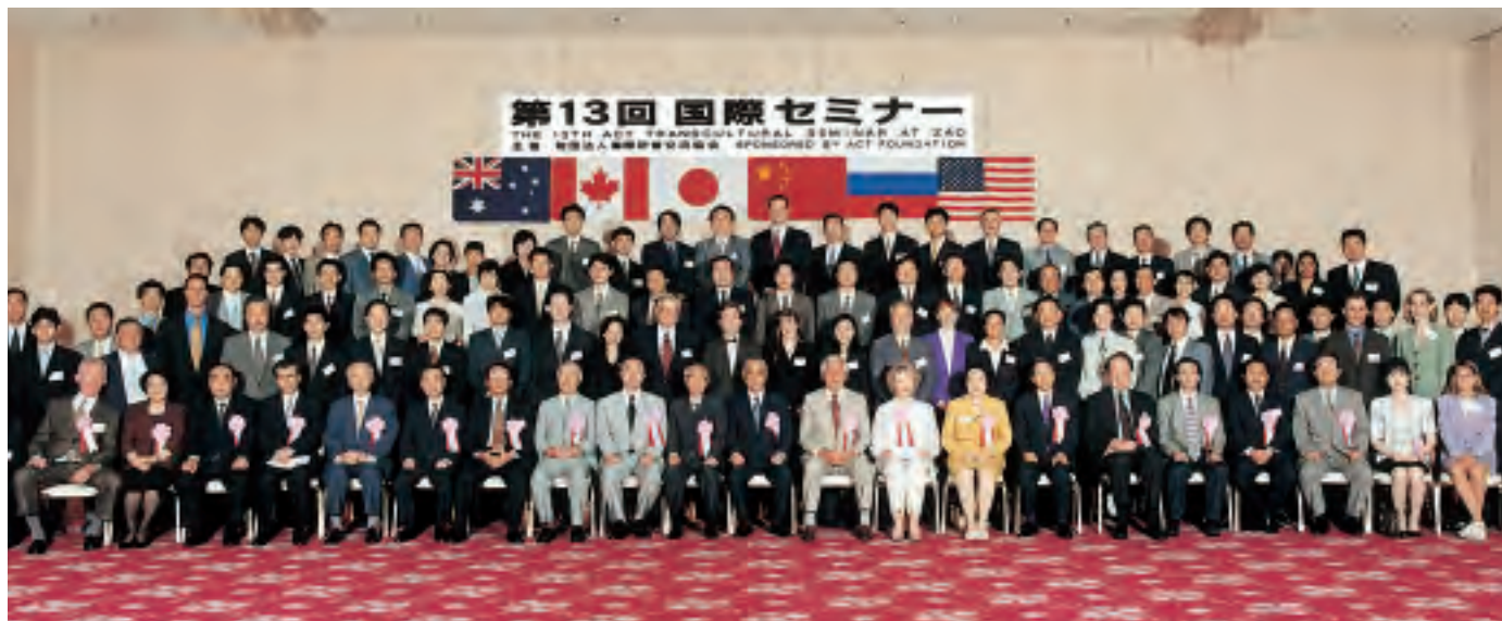
第13回国際セミナー