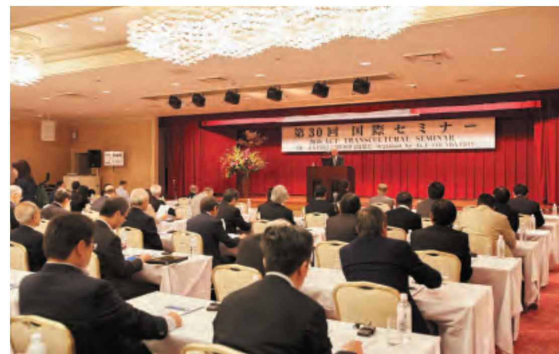
第30回国際セミナー

開催場所: 福島県北塩原村裏磐梯 開催月日: 2017年9月1日~9月3日 テーマ: 『人と地域を繋ぐ復興と国際貢献について』 “Reconstruction and International Contribution to Connecting People and Regions” 後援: 内閣府、復興庁、総務省、外務省、文部科学省、農林水産省、経済産業省、国土交通省、環境省、福島県、一般社団法人日本経済団体連合会、一般社団法人東北経済連合会、独立行政法人国際協力機構、一般財団法人衛星測位利用推進センター、一般社団法人海外水循環システム協議会