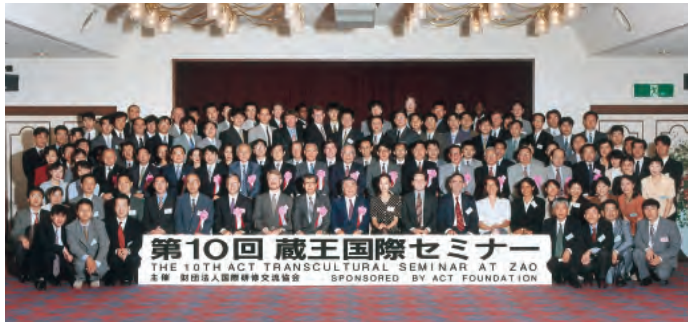
第10回国際セミナー