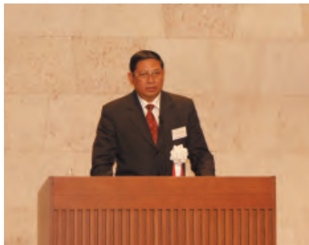
スシロ・バンバン・ユドヨノ インドネシア共和国大統領 (当時: 政治・社会・治安担当調整大臣) 第15回国際セミナー