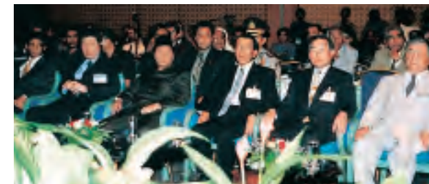
第2回アジア太平洋セミナー