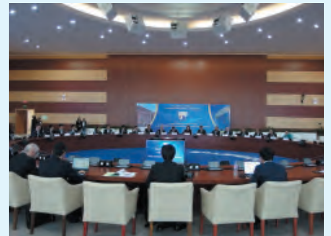
第14回アジア太平洋セミナー（2019年） 開催：ロシア連邦 ウラジオストク市 極東連邦大学