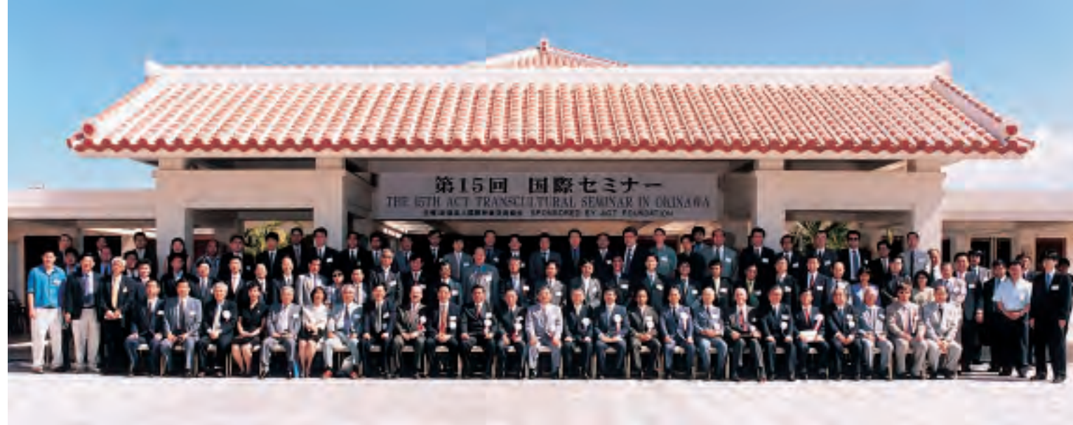
第15回国際セミナー