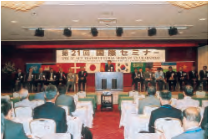
第21回国際セミナー