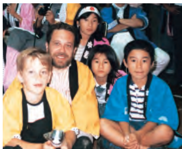
ロバート B. ライシュ (クリントン政権労働長官、カリフォルニア大学教授) Robert B. Reich 第2回裏磐梯国際セミナー

文化を理解するには、お互いの生き方や生き方の違いについての深いセンスが必要だ。各国の若者が共に学び合う機会を持つことは素晴らしいと思う。