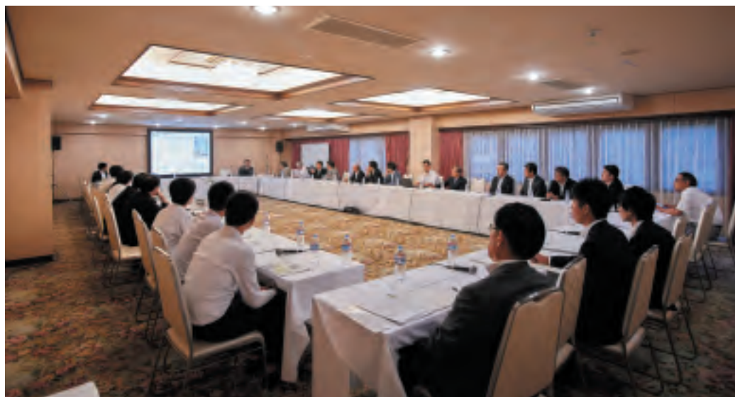
第31回国際セミナー