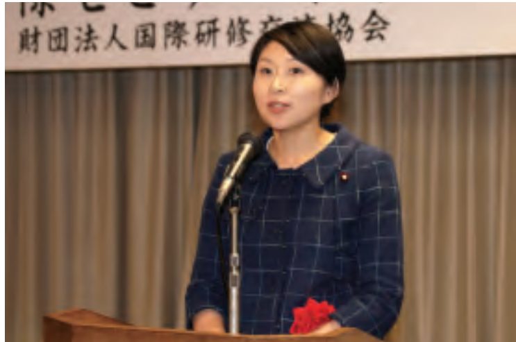
小淵優子 (内閣府特命担当大臣) 第23回国際セミナー