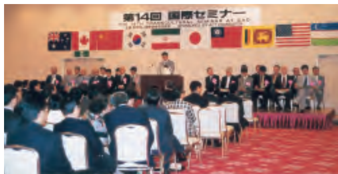
第14回国際セミナー