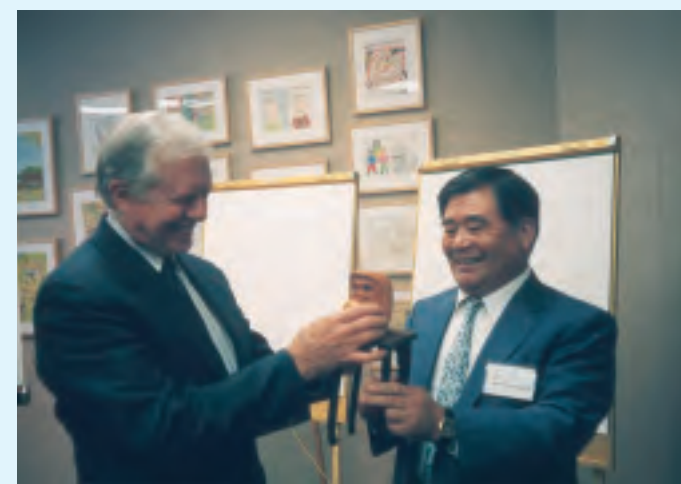
カーター元大統領にダルマを贈呈