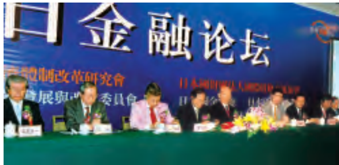
第17回日中産業科学技術交流シンポジウム