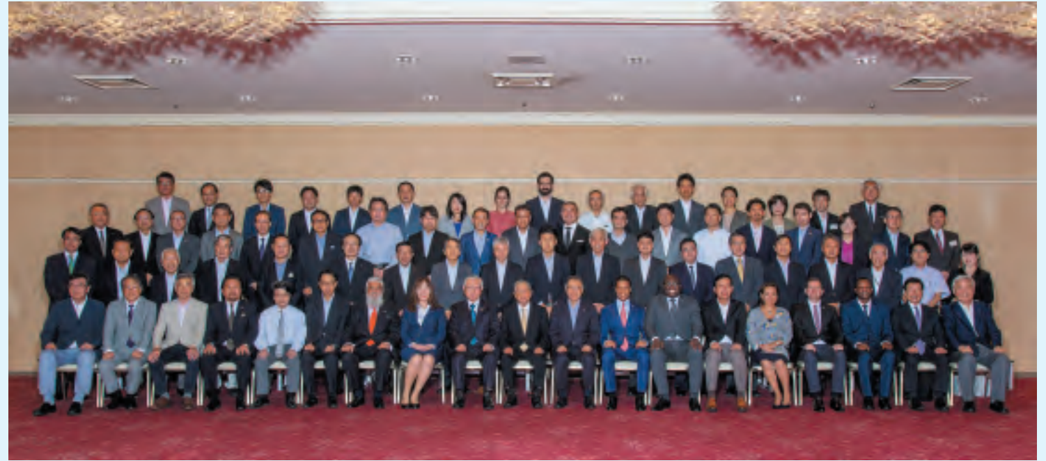
第33回国際セミナー（2019年） 開催：福島県北塩原村裏磐梯