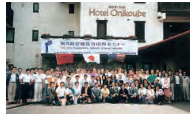
第5回宮城鬼首国際セミナー