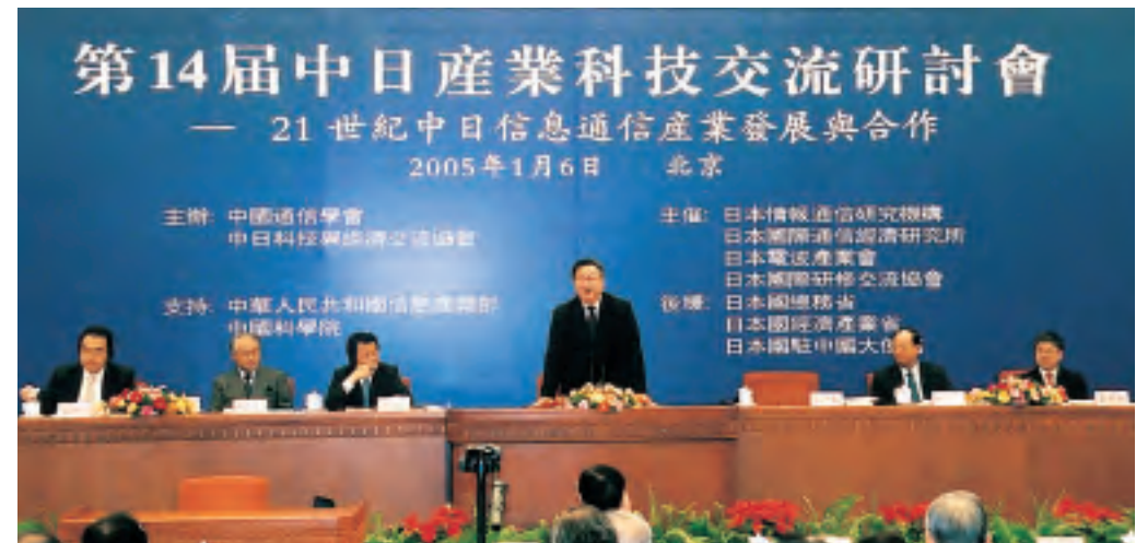
第14回日中産業科学技術交流シンポジウム