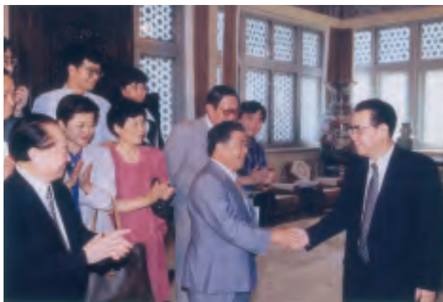
李鵬総理（右）、汪道涵元上海市長・海峽両岸関係協会会長（左）