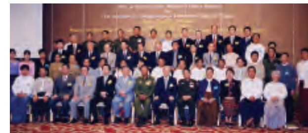
第1回アジア太平洋セミナー