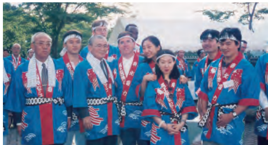
竹下登 衆議院議員・元首相 (前列左から3人目) 第10回国際セミナー