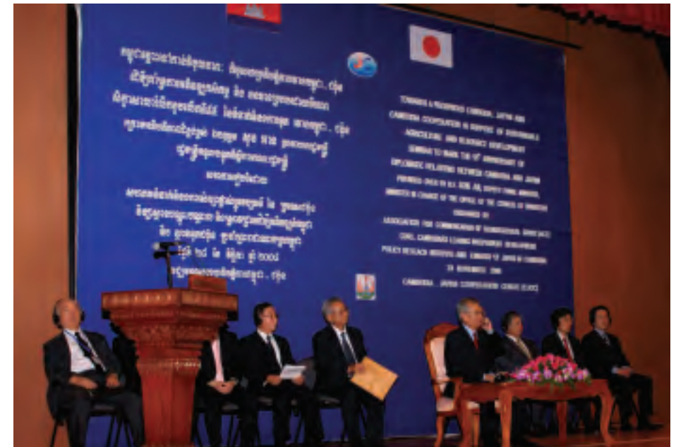
第8回アジア太平洋セミナー