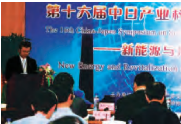
第16回日中産業科学技術交流シンポジウム